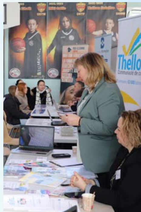
LE 10 È FORUM DE L'EMPLOI ET DE LA FORMATION PROFESSIONNELLE PROPOSAIT CETTE ANNÉE 68 STANDS !