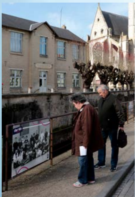
DEPUIS DÉBUT AVRIL, UNE EXPOSITION DÉDIÉE AUX ASSOCIATIONS SPORTIVES DE CHAMBLY EMBELLIT LES BORDS DE L'ESCHES