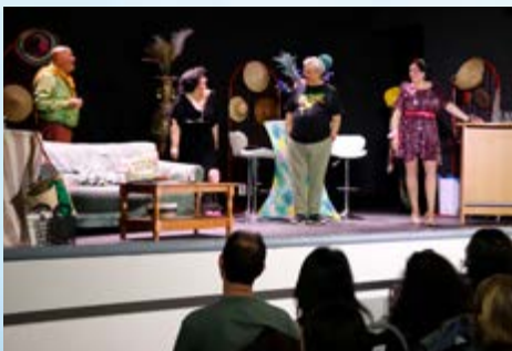
THÉÂTRE D'IMPRO, PIÈCE HUMORISTIQUE, LE CLEC A OFFERT DE JOLIS MOMENTS DE CULTURE !