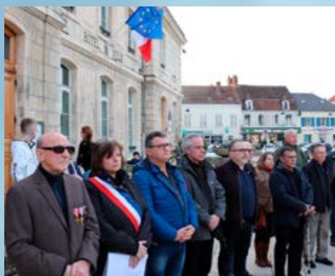
ÉLUS ET HABITANTS ONT COMMÉMORÉ LA FIN DE LA GUERRE D'ALGÉRIE, LE 19 MARS DERNIER