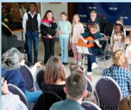
LE CONCERT DE PRINTEMPS DES ÉLÈVES DE L'ÉCOLE DE MUSIQUE A FAIT SALLE COMBLE