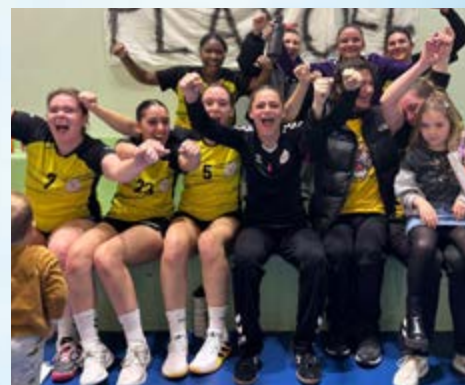
L'ÉQUIPE FÉMININE SENIORS DU HANDBALL CLUB S'EST QUALIFIÉE POUR LES PLAY-OFFS DE SA CATÉGORIE